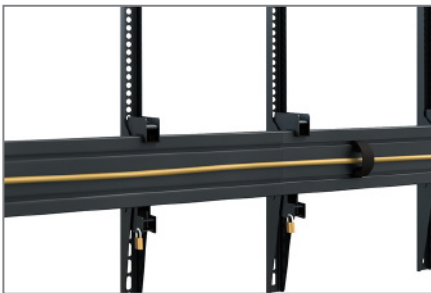
Kabelmanagement mittels Kabelclips