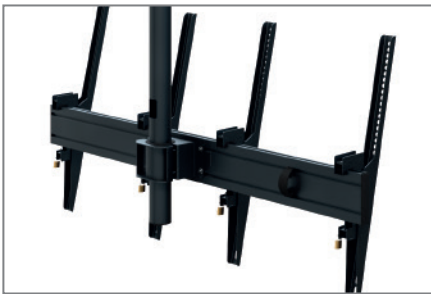
Anpassbar dank modularer Bauweise