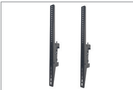
VESA max. 400 x 600 mm

Die Komplettlösungen sind mit den Einzelkomponenten der comPROnents®-Serie uneingeschränkt kombinierbar und erweiterbar und bieten so weitere Einsatzmöglichkeiten.